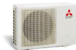
MUH-07 RV MUH-09 RV MUH-12 RV