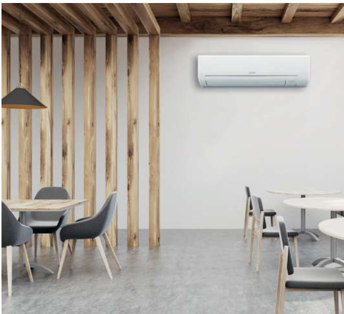
FLUSSO D'ARIA AD AMPIO RAGGIO

LONG: Con questa funzione il lancio dell'aria può raggiungere 12 metri: l'ideale per locali particolarmente lunghi.